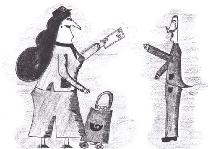
Ilustrace Kamil Bublík