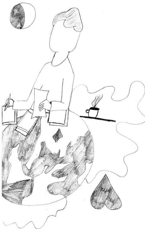
Ilustrace Sandra Košťálková

se za hlavu, jaký to je trapas, že spím. Předložím jízdenku. Takový pitomý sen! Konečně se začtu do ekonomie a pak už ani nevnímám, že venku přestalo pršet. Opakuju si kapitolu za kapitolou a vlak mívá Děhylov, Jilešovice, Háj ve Slezsku, Lhotu u Opavy, Mokré Lazce, Štítinu... Mám pocit, že už tu ekonomii umím. Jedeme Komárovem kolem Tevy. Blížíme se k Opavě. Pousměju se. Po víkendu už konečně na intru... Hlavně, že jsem tu cestu zase přežila.